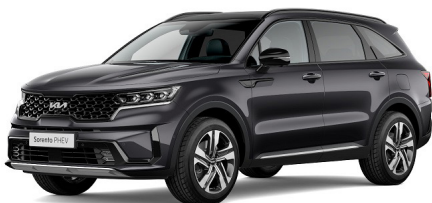
Platinum Graphite (ABT) metallic