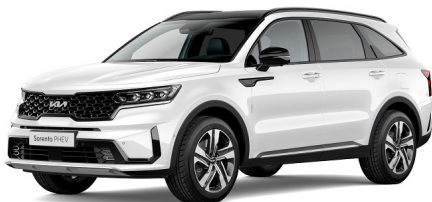
Snow White Pearl (SWP) metallic pearleffekt