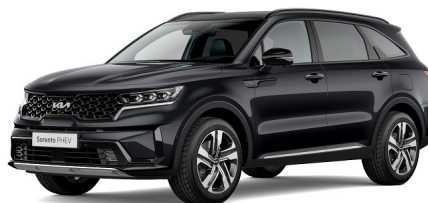
Aurora Black Pearl (ABP) metallic pearleffekt

Kia Sweden AB Kanalvägen 10A 194 61 Upplands Väsby Sverige Tfn: 08 - 400 443 00 www.kia.com