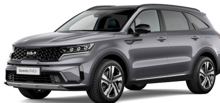
Steel Grey (KLG) metallic