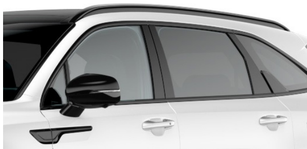
Svarta exteriöra detaljer