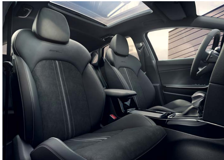
Suède sportstoelen - zwart GT-Line

Stoelbekleding in suède met lederlook. Bovenste gedeelte van de stoelen en de hoofdsteunen afgewerkt in lederlook met herkenbaar GT-Line logo. Stoelzitting en rugleuning afgewerkt in suède.