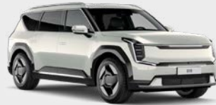
Ivory Silver Glossy Kleurcode: ISG