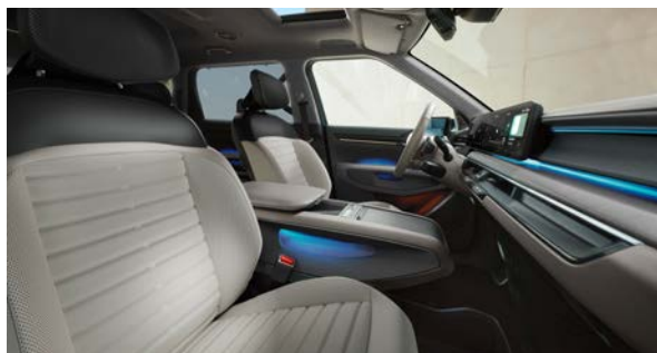
Vegan lederen bekleding - lichtgrijs met donkergrijs

Stoelzitting in lichtgrijs met gewatteerde horizontale afwerking, het bovenste gedeelte van de rugleuning en hoofdsteun afgewerkt in donkergrijs. Dashboard met duurzame materialen en lichtgrijze tinten.