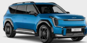
Ocean Blue Glossy Kleurcode: OBG