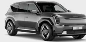
Pebble Grey Kleurcode: DFG