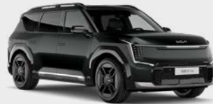
Aurora Black Pearl Kleurcode: ABP