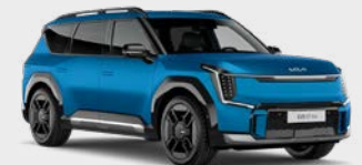
Ocean Blue Matte Kleurcode: OBG