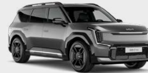
Pebble Grey Kleurcode: DFG