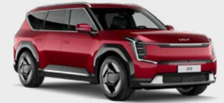
Flare Red Kleurcode: C7R