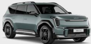
Iceberg Green Kleurcode: IEG