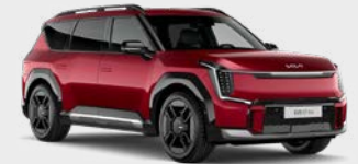
Flare Red Kleurcode: C7R