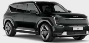
Aurora Black Pearl Kleurcode: ABP