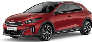
Infra Red (AA9)