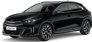
Black Pearl (1K)