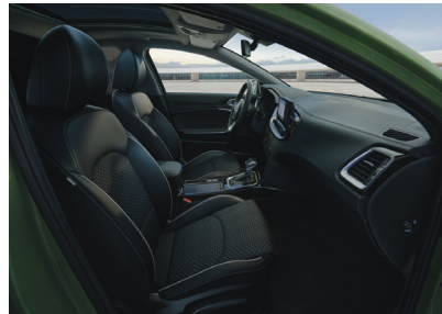
Választható szintetikus bőr/textil kárpitozás X-GOLD és X-PLATINUM felszereltséghez (CPB fehér varrással) Választható szintetikus bőr/textil kárpitozás X-GOLD és X-PLATINUM felszereltséghez (CPK kék varrással)