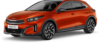
Orange Fusion (RNG)