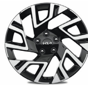
18" könnyűfém keréktárcsa