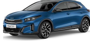
Blue Flame (B3L)