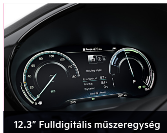
12.3" Fulldigitális műszeregység