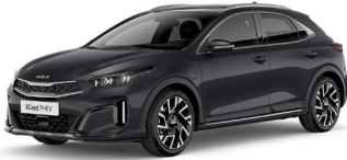
Penta Metal (H8G)