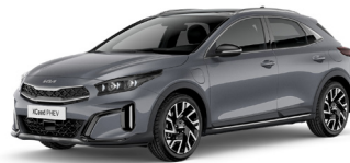
Lunar Silver (CSS)