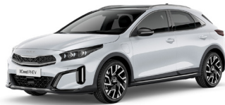
Deluxe White (HW2)