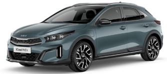
Yuca Steel Gray (USG)