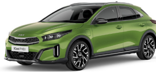
Celadon Spirit Green (CE6)