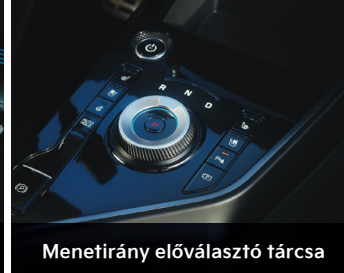
Menetirány előválasztó tárcsa