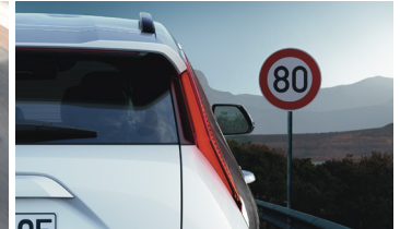
Sebességkorlátozást kijelző rendszer (SLIF)