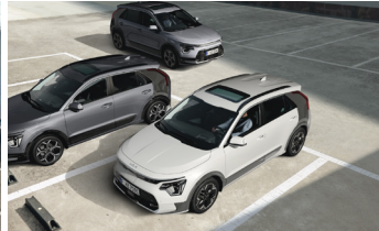
Parkolásiütközés-elkerülő asszisztens (PCA)