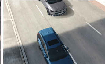
Holtérfigyelő rendszer, aktívfékezés-funkcióval (BCA)