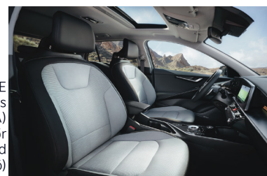
KRYPTONITE világos (színkód GRA) szintetikus bőr kárpit (sztenderd választható)