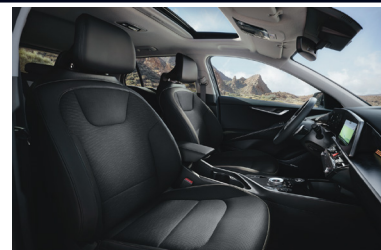
KRYPTONITE fekete szintetikus bőr kárpit (sztenderd választható)