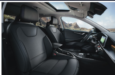
GOLD / PLATINUM fekete szintetikus bőr - szövet kárpit (sztenderd)