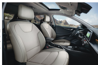
GOLD / PLATINUM világos (színkód GRA) szintetikus bőr - szövet kárpit (opciós)