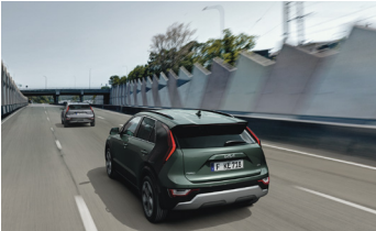
Navigációalapú adaptív tempomat Stop&Go funkcióval (NSCC)