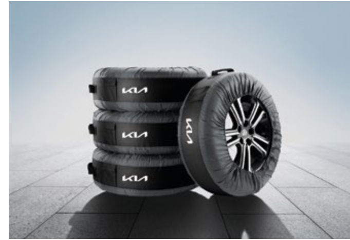
Keréktároló táskák. Négydarabos táskakészlet, amivel a kerék, a ruházat és a garázs tisztasága is megőrizhető, sőt a kerekek szállításakor az utatertet is megóvják az elkoszolódástól. 66495ADB01