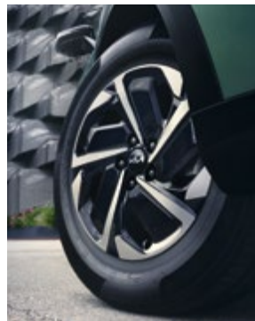
17"-os könnyűfém kerék, B típus. Kétszínű, 7,0Jx17 méretben, 215/65 R17-os abroncsokhoz. 52910R2160PAC