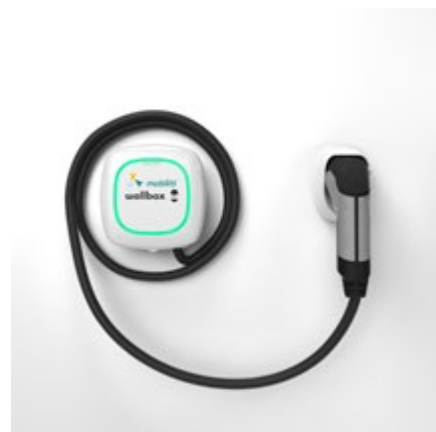
Wallbox Pulsar Plus, fehér

Mi lehetne annál egyszerűbb és kényelmesebb, mint otthon tölteni az autót? Semmi! Ezzel a megoldással teljesen gondtalanul, akár az éjszakai áram kedvező árát kihasználva töltheted ismét 100%-ra az akkumulátorokat, minden reggel energiával telve vágatsz neki a napnak.