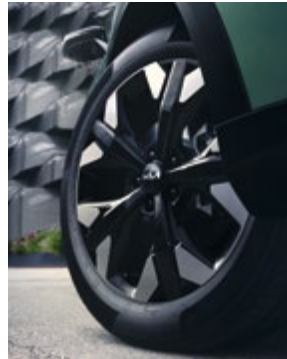
19"-os könnyűfém kerék, B típus. Kétszínű, 7,5Jx19 méretben, 235/50 R19-os abroncsokhoz. 52910CJ360PAC (Csak a PHEV modellhez.)