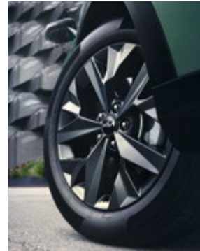
18"-os könnyűfém kerék, B típus. Kétszínű, 7,5Jx18 méretben, 235/55 R18-os abroncsokhoz. 52910R2260PAC (Csak a GT-Line.)