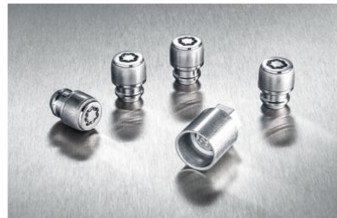
Kerékőr és célszerszám. Ezek a különleges csavarok csak speciális szerszámkulccsal lazíthatók meg, így védelmet nyújtanak a tolvajok ellen. 66490ADE51