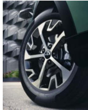
18"-os könnyűfém kerék, A típus. Kétszínű, 7,5Jx18 méretben, 235/55 R18-os abroncsokhoz. 52910R2200PAC