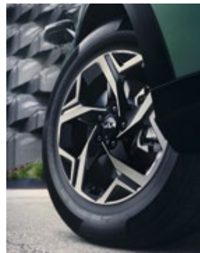
17"-os könnyűfém kerék, A típus. Kétszínű, 7,0Jx17 méretben, 215/65 R17-os abroncsokhoz. 52910R2100PAC (Csak ICE és MHEV modellekhez.)