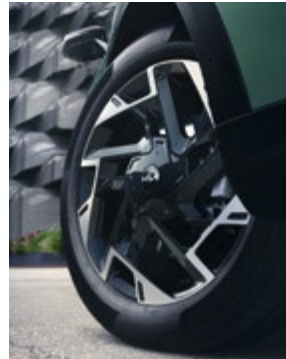
19"-os könnyűfém kerék, A típus. Kétszínű, 7,5Jx19 méretben, 235/50 R19-os abroncsokhoz. 52910R2300PAC (Csak a GT-Line.)