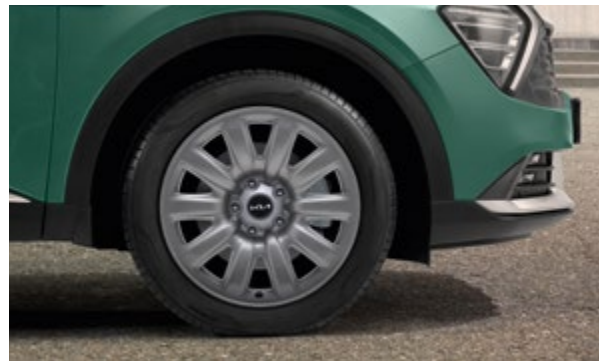
17"-os acélkerék. 7,0Jx17, világosgrafit-színű, 215/65 R17 méretű abroncshoz. A készlet a díztárcsát is magában foglalja, a felszereléshez az eredeti csavarok használhatóak. R2401ADE07