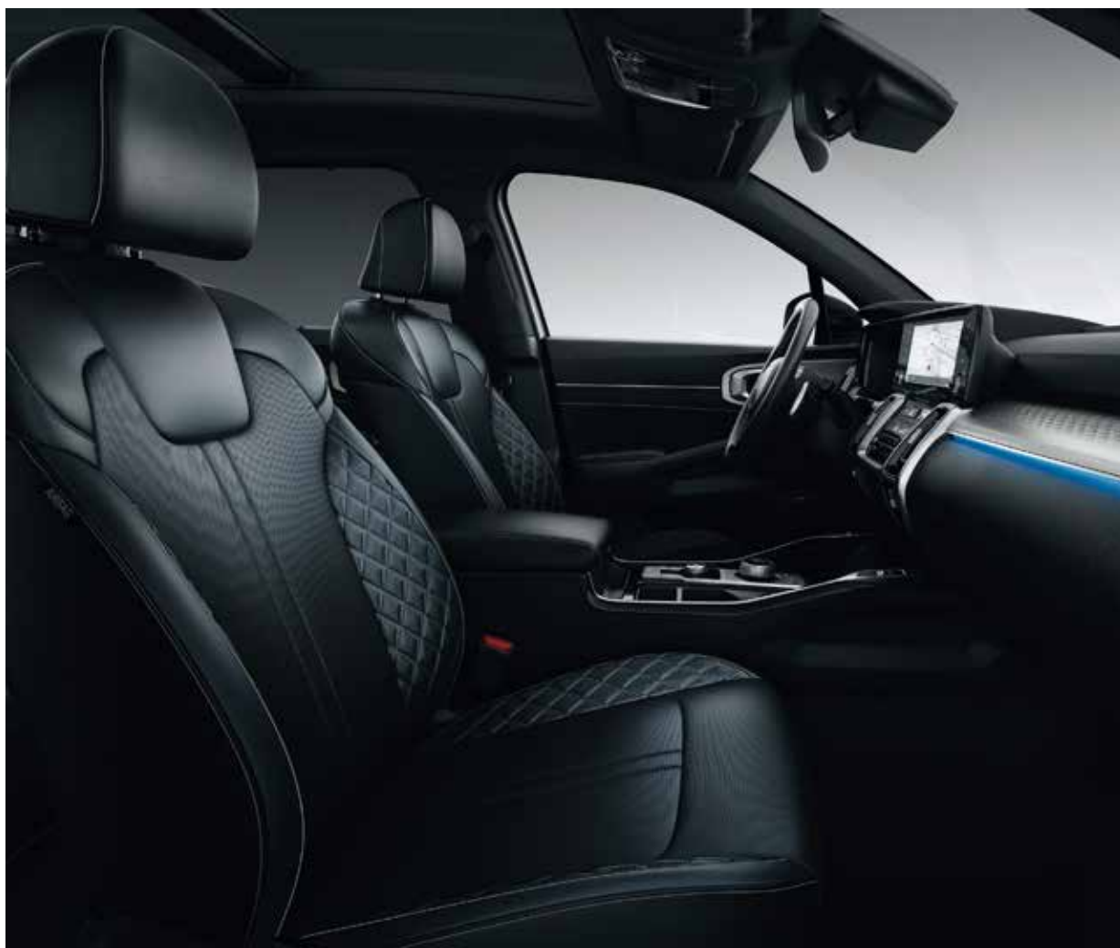
Tapicería Black Edition

Para ese elegante toque final, todos los asientos de cuero vienen con una decoración en capas cepilladas y con relieve 3D de TOM, mientras que los asientos de tela negra vienen con una decoración de pintura de efecto metálico con relieve 3D. Además, hay una opción impresionante de asientos de cuero gris y asientos de cuero negro con detalles en color negro de un solo tono. Los asientos de napa negra también se complementan con un techo interior negro.