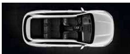
3ª fila plegada completamente plana