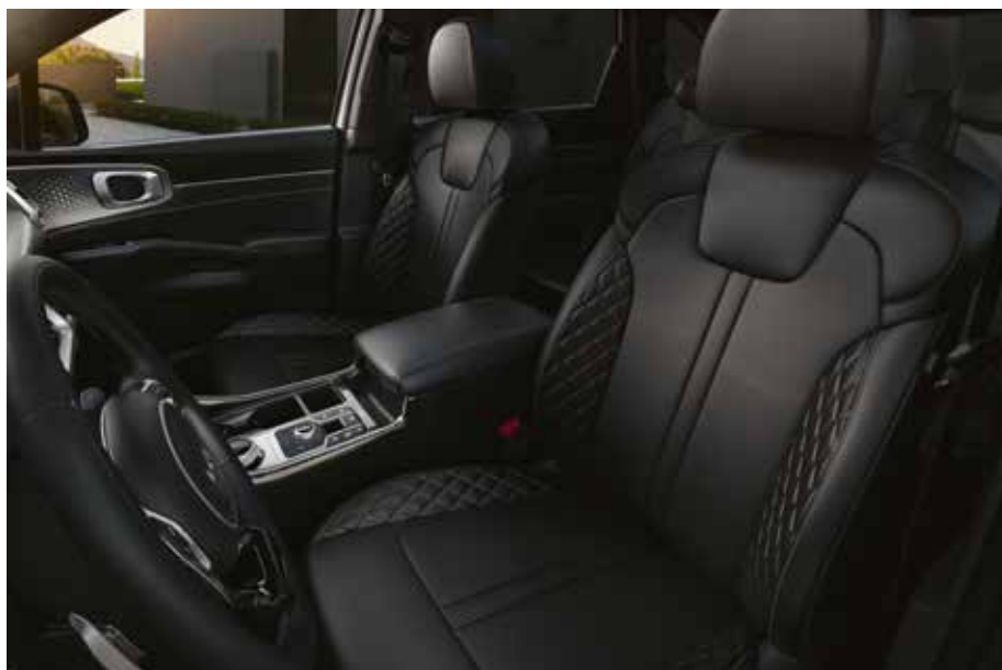
Tapicería en piel para black edition