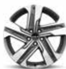
Llanta de aleación de 48 cm (19") (disponibles en diésel, HEV y PHEV)