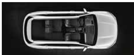
2ª fila parcialmente plegada (5 plazas)