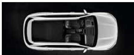
2ª fila plegada totalmente plana (5 plazas)

Cuando tu cabeza te impulse a sobrepasar los límites, el Sorento te ayuda a hacerlo con estilo. Es por eso que encontrarás lo último en confort, espacio y flexibilidad envuelto en su atrevido diseño exterior.