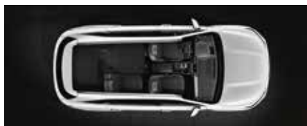
3ª fila doblada completamente plana y 2ª fila parcialmente doblada