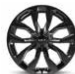
Llanta de aleación de 51 cm (20") (para black edition diésel)

De conformidad con la Normativa (EU) 2020/740 sobre eficiencia de neumáticos y otros parámetros consulta nuestro sitio web [ www.kia.com ]. La información facilitada sobre neumáticos es meramente informativa.