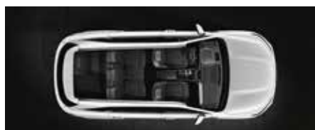
3ª fila parcialmente plegada