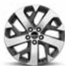
Llanta de aleación de 46 cm (18") (solo para diésel)